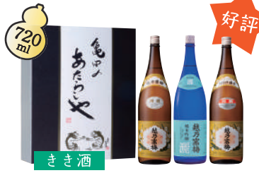
A-5 越乃寒梅 きき酒 ¥4,840(税込)