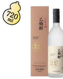
A-2 越乃寒梅 十年古酒 乙焼酎 ¥8,030(税込)

最新の設備、職人の技術のもと造られ、10年間熟成された渾身の逸品。極めて僅かな生産量の超限定酒です。