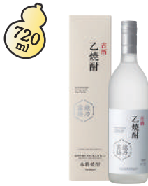
A-1 越乃寒梅 古酒 乙焼酎 ¥4,950(税込)