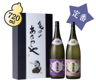
A-3 越乃寒梅 厳選 ¥5,390(税込)

最新の設備、職人の技術のもと造られ、10年間熟成された渾身の逸品。極めて僅かな生産量の超限定酒です。