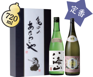
A-4 純米大吟醸 味くらべ ¥5,500(税込)