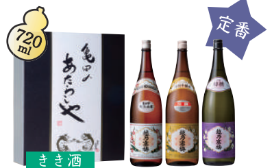
A-6 越乃寒梅 きき酒 ¥5,390(税込)